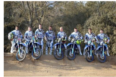
HUSABERG Factory Racing Team 2013

Am 15. März startet für das acht Mann starke Husaberg Factory Racing mit dem Auftakt der Enduro-Weltmeisterschaft in Chile die Saison 2013.